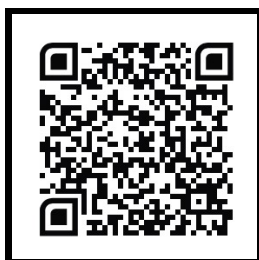
ขั้นตอนการลงทะเบียนรับสิทธิ์