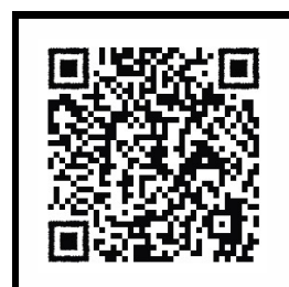
เอกสารใบสำคัญรับเงิน